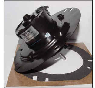
Unidad original del fabricante

El motor del ventilador que se encuentra en las camoinetas comerciales Ford serie E, modelos 2013-1997 experimentan fallos prematuros debido a la ubicación de la unidad y las demandas de carga extrema. Este motor está situado en el compartimiento del motor expuesto a algunas temperaturas intensas debajo del capó. El cual causa daños graves, como cables fundidos, conectores rotos, y hasta en unos casos se han reportado incendios.